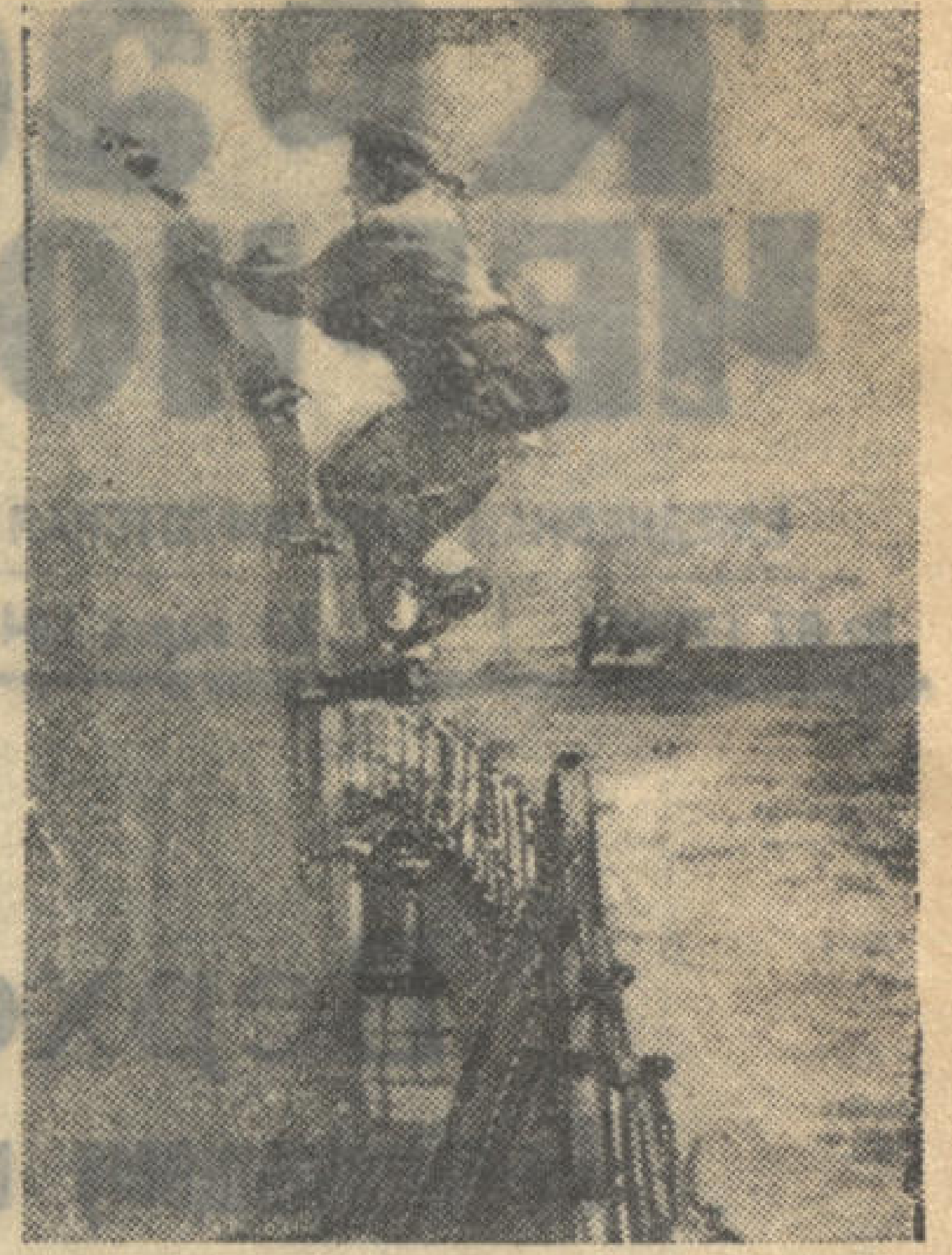
По боевой тревоге.