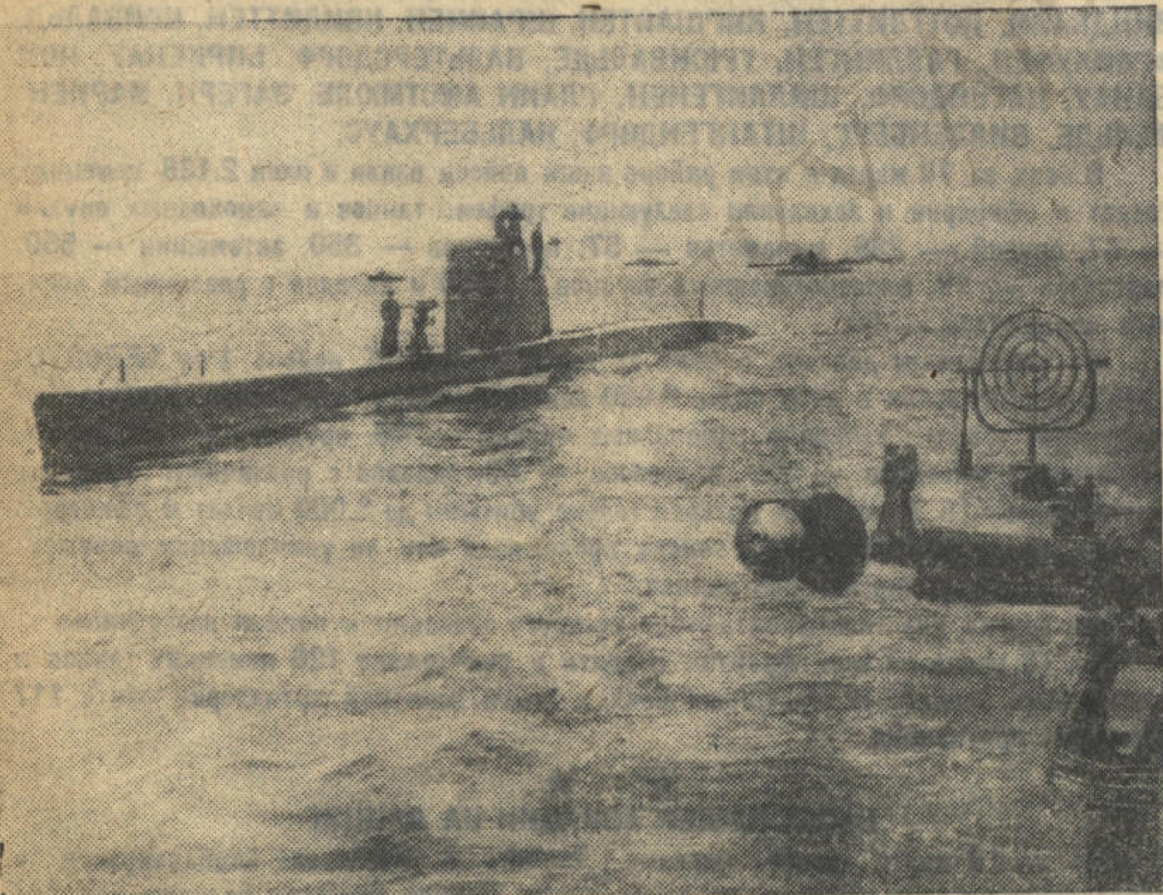
Учебный поход подводных кораблей.