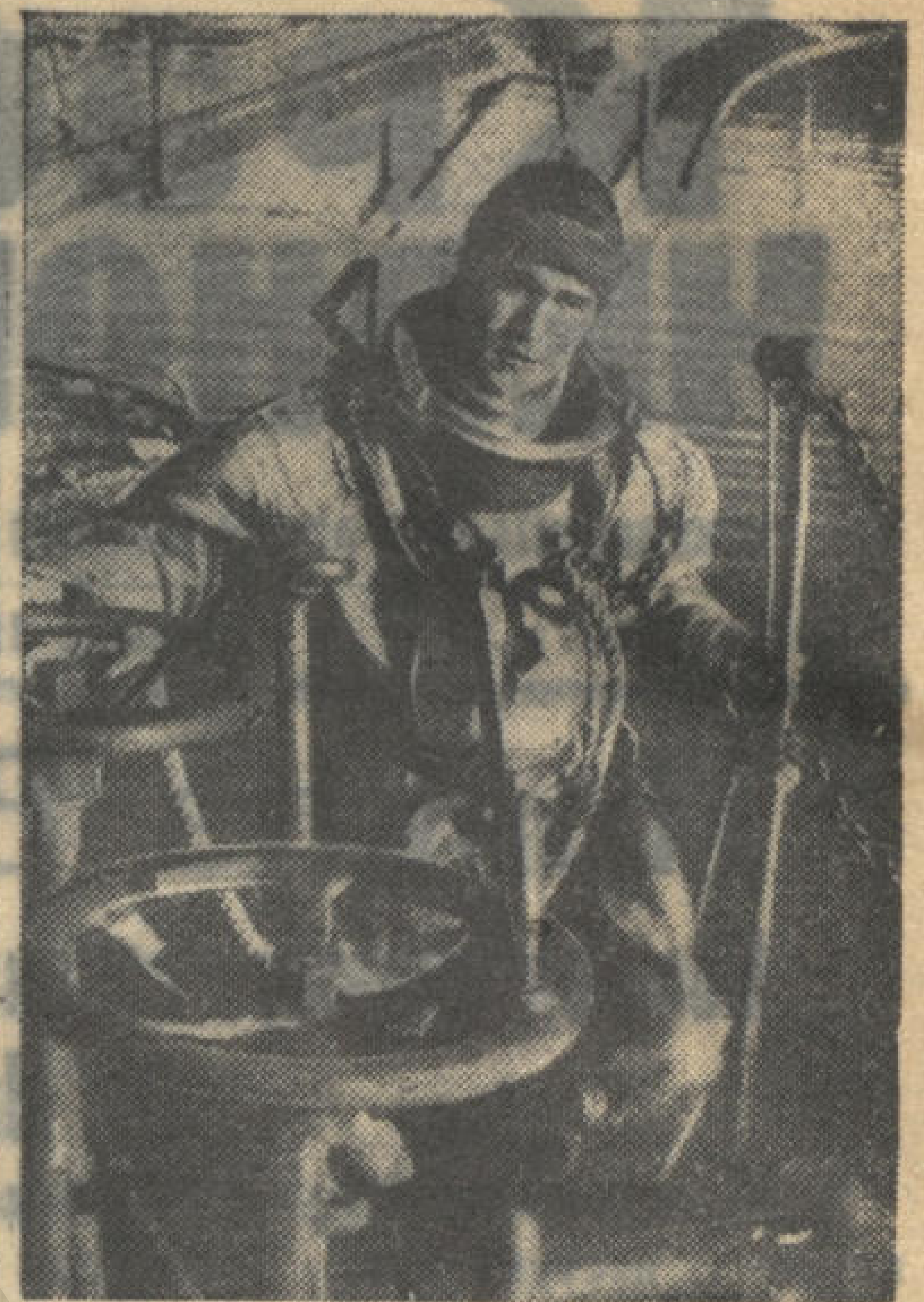
Один из лучших водолазов нашего флота старшина 1 статьи В. ВЯТКИН награжден орденом Отечественной войны 1 степени и четырьмя медалями.