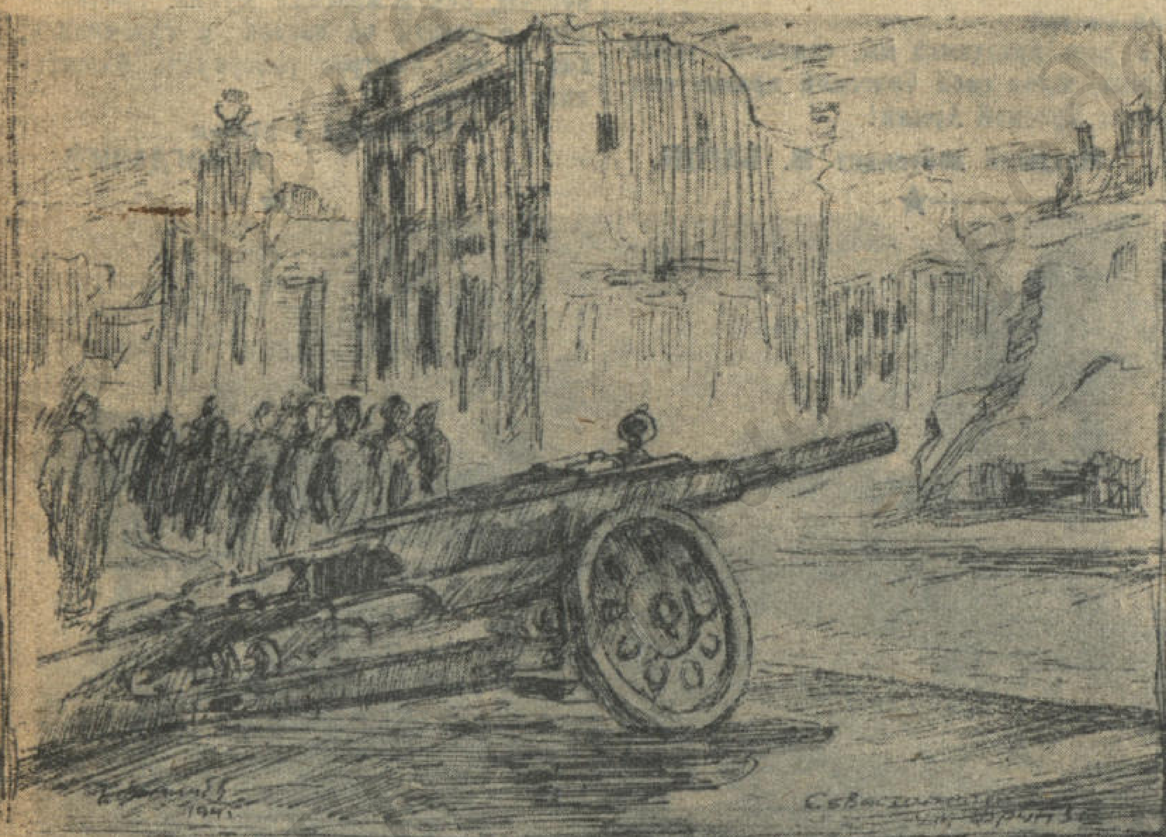
ПУТЬ, ПО КОТОРОМУ ШЛА ПОБЕДОНОСНАЯ КРАСНАЯ АРМИЯ.—Во время боев за освобождение Севастополя. Подбитое немецкое орудие на улице Фрунзе. Рисовка Г. Фомичева.

В ДВМФ 10.00 — детский утренник. 14.00 — спектакль театра имени Луначарского. Пьеса К. Симонова «Так и будет». 19.30 — концерт московской бригады Всесоюзного гастрольно-эстрадно-концертного объединения.