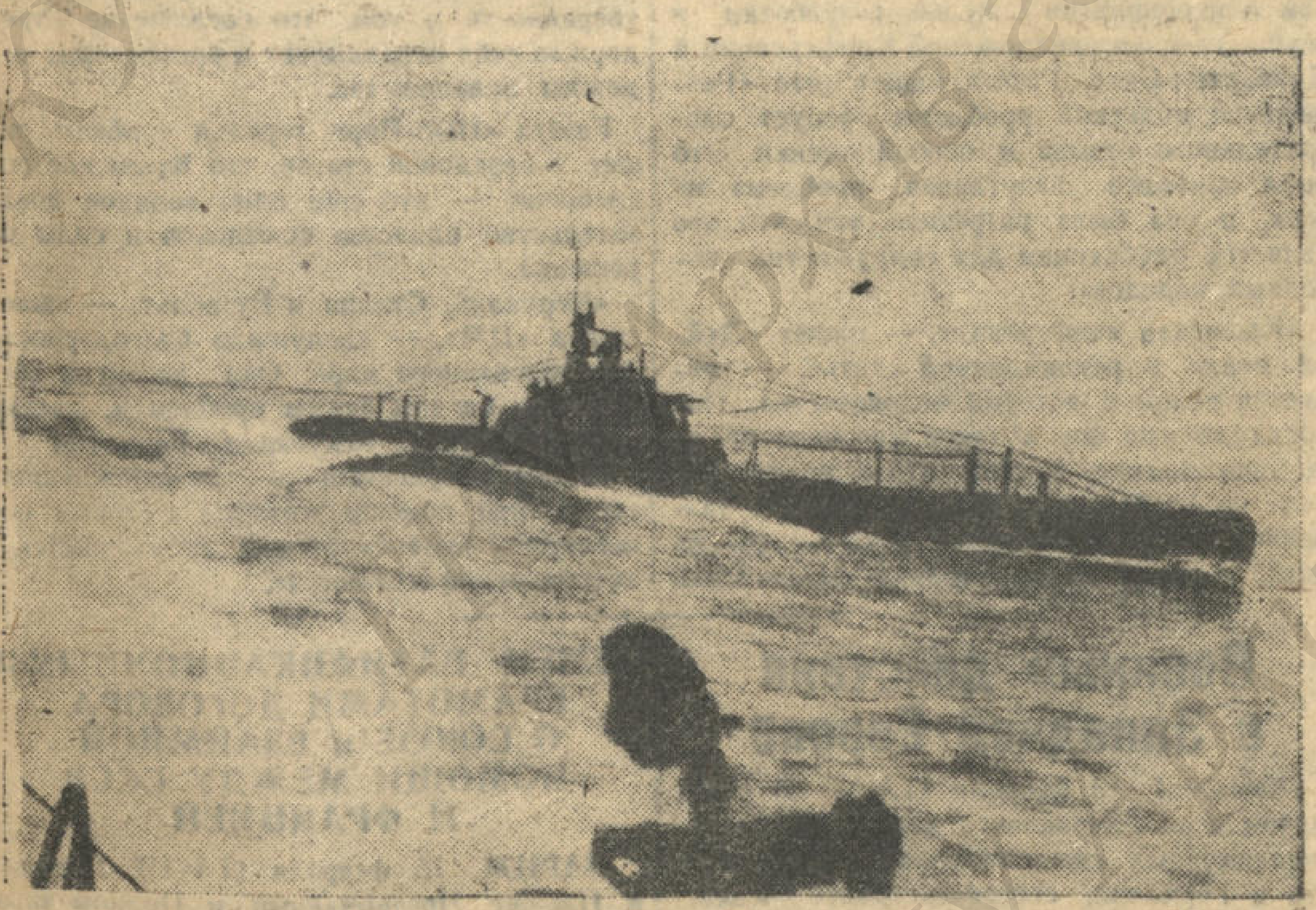
Возвращение из похода.