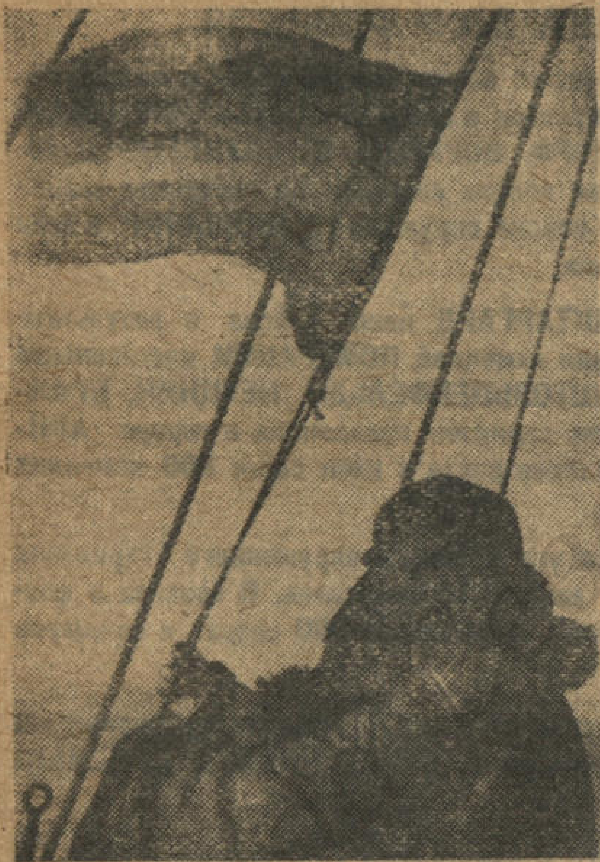
Январь. Восемь часов утра. Ясно и холодно. Сигнальщик поднимает флаг корабля.