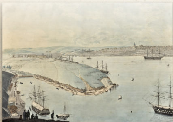
Строительство Нового адмиралтейства в г. Севастополе. Рисунок. 1835-1837 гг.

Бриг «Меркурий» Водоизмещение: 445 т Длина между перпендикулярами: 28,65 м Длина по верхней палубе: 29,46 м Ширина по мидельшпангоуту: 9,398 м Ширина с обшивкой: 9,7 м или 9,602 м Двигатели: парусная и весельная оснастка Площадь парусности: 856 м Экипаж: 115 человек Вооружение: 24-фунтовых карронад — 18 ед. 3-фунтовых пушек длинноствольных — 2 ед. Мощность бортового залпа: 216 фунтов