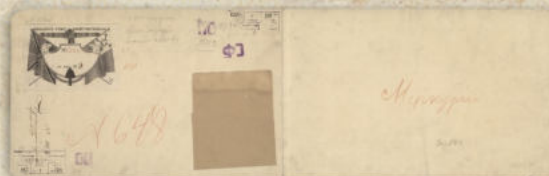
Практический чертеж брига «Меркурий». 18 сентября 1805 г.

Черноморской Исполнительной Экспедиции 1797 22 апреля 1820 г. ВЪ Слѣдствіе представленія оной Экспедиціи за № 226 м предлагаю, предоставить Севасто- польской портовой Канцелярии Строить въ таинственномъ Портѣ Брѣвъ № 1 ю и строитъ Константину съестный на воду назначенный киль, и брѣвъ наименовать Меркурій, а по окончаніи въ награду корабельному Мастеру за страховку снаго пѣтдесять рублей, выдать изъ казначейства сдѣланы наказы въ Кораблестроительной. Свѣдѣнія Предписаніи 22. Апрель 1820 года