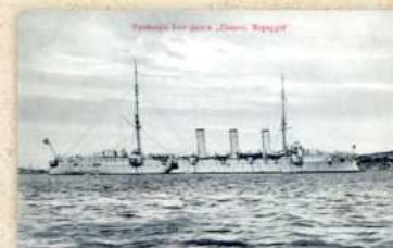
Крейсер 1 ранга «Память Меркурия»

Спасательный буксир «Меркурий» (бывший паровой однопалубный буксир «Le Rude») в 1935 г. приобретен для пополнения Экспедиции подводных работ особого назначения (ЭПРОН). С 22 июня 1941 г. - в составе Аварийно-спасательной службы Черноморского флота. В июне 1942 г. одним из последних ушел из осажденного Севастополя, буксируя спасенный им танкер «Серв». В июле 1944 г. первым из спасательных судов Черноморского флота вернулся в освобожденный Севастополь и еще долгие годы продолжал свою службу по оказанию помощи кораблям Черноморского флота.