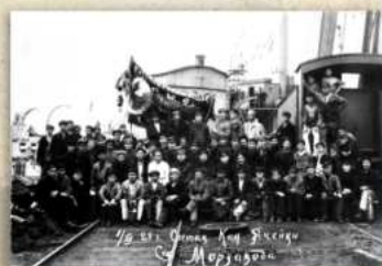
Состав Ком. ячейки