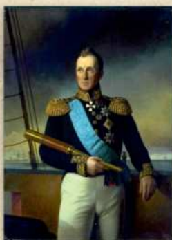
Портрет Адмирала Алексея Самуиловича Грейга.

Указ императора Николая I о пожаловании брига «Меркурий» «кормового 2-й дивизион флага со знаменем Святого Великомученика и Победоносца Георгия с принадлежащим к нему выпелом», 14 июля 1829 г.