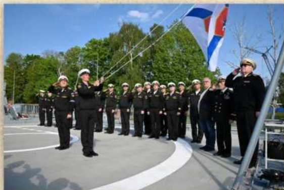
Подъем Георгиевского Военно-морского флага Российской Федерации на корвете «Меркурий». Балтийск. 13 мая 2023 г.

В 2019 г. во время посещения Севастополя Президент Российской Федерации В.В. Путин поддержал предложение ветеранов Военно-морского флота вернуть в состав российского флота имя славного брига «Меркурий».