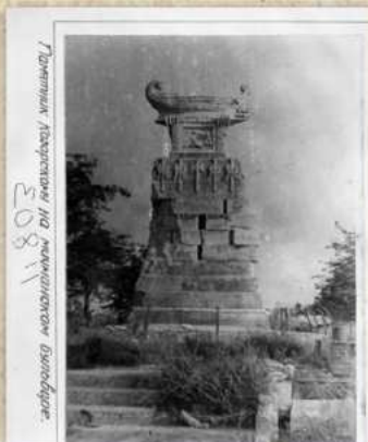
Памятник Казарскому и бригу «Меркурий».

Извещение канцелярии начальника главного морского штаба о передаче в Севастополь пожертвования в размере 5000 рублей, пожалованного императором Николаем I на возведение памятника А.И. Казарскому. 6 февраля 1834 г.