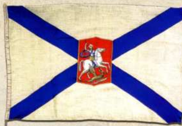
Георгиевский кормовой флаг.

Приказ Главного командира Черноморского флота и портов адмирала А.С. Грейга о пожалованных императором Николаем I наград экипажу брига «Меркурий». 25 июня 1829 г.