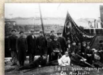
Группа активных работников

Севастопольского Морского завода у Почетного Красного знамени. Севастополь. 1 декабря 1923 г.