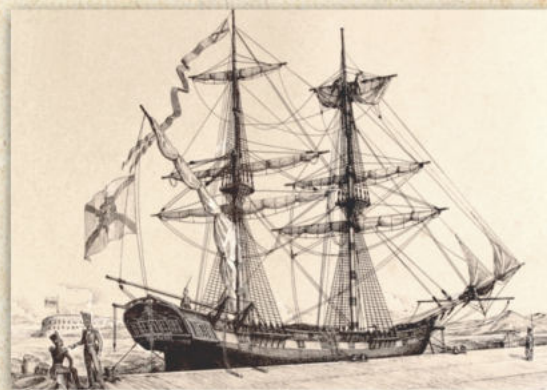
Бриг «Меркурий». Литография