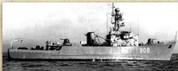
Минный тральщик «Александр Казарский»