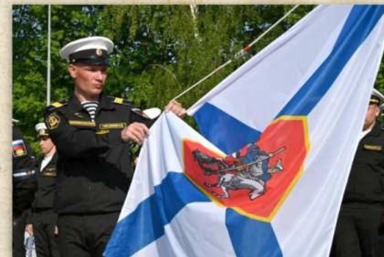
Торжественная церемония подъема Георгиевского Военно-морского флага Российской Федерации на корвете «Меркурий». Балтийск. 13 мая 2023 г.

В Российской империи всего два корабля были удостоены награждения Георгиевским флагом: линейный корабль «Азов» (1827 г.), бриг «Меркурий» (1829 г.).