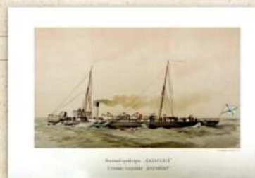
Минный крейсер «Казарский».