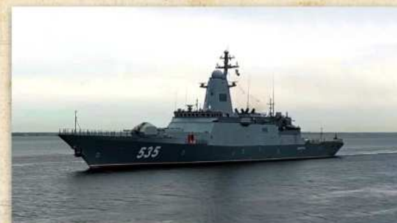
Корвет «Меркурий» во время ходовых испытаний.