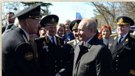
Президент Российской Федерации В.В. Путин на встрече с ветеранами Военно-морского флота. Севастополь. 2019 г.

В 2019 г. во время посещения Севастополя Президент Российской Федерации В.В. Путин поддержал предложение ветеранов Военно-морского флота вернуть в состав российского флота имя славного брига «Меркурий».