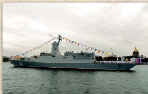
Корвет «Меркурий» в строю кораблей — участников военно-морского парада в дни празднования Дня ВМФ России. Санкт-Петербург. 2022 г.

Корабль имеет стальной гладкопалубный корпус и надстройку от борта до борта из многослойного стеклопластика. Корпус и надстройка выполнены с учетом требований технологии «стелс». Новые обводы подводной части корпуса позволили снизить на 25% сопротивление воды при движении корабля и, одновременно, потребную мощность его главной энергетической установки.