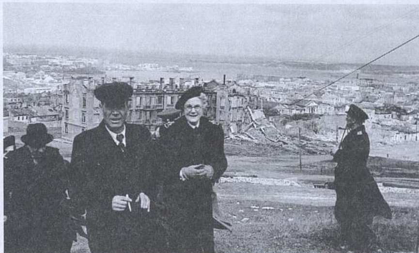
Клементина Черчилль во время визита в Севастополь. 24 апреля 1945г.