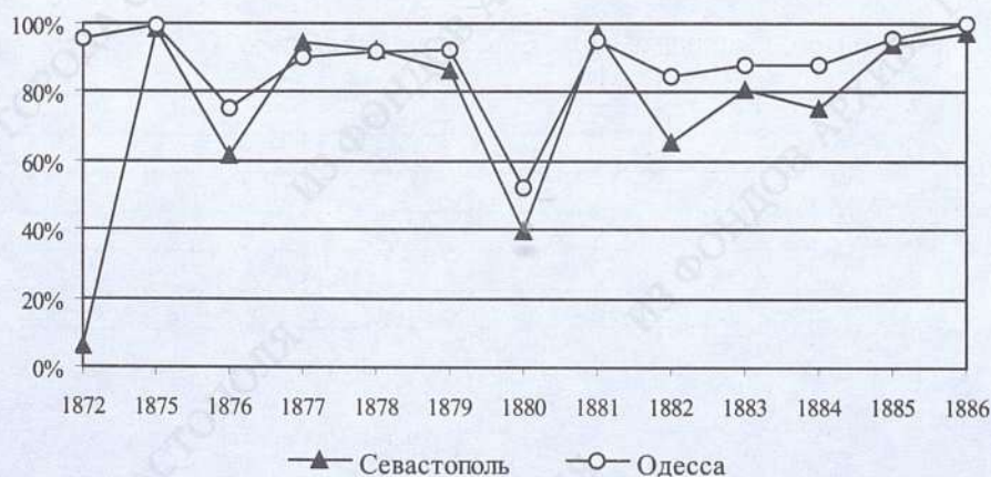
Рисунок 6. Доля зерновых в экспортном грузопотоке через Севастопольский и Одесский порты, 1872–1886 гг., %

Динамика экспорта муки представлена в таблице 4. Наиболее существенные изменения в данных по Севастополю наблюдаются в 1877, 1880 и 1885 гг. Снижение экспорта муки в 1877 г. еще раз иллюстрирует ситуацию военного времени, когда сокращались все грузоперевозки, рост экспорта в 1880 г. через Севастополь объясняется возвращением к нормальной работе порта, а также и тем,