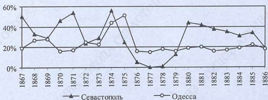
Рисунок 3. Доля российских кораблей в импорте через Севастопольский и Одесский порты, 1867–1886 гг., %