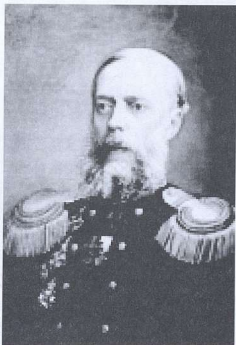
Карл Федорович Кульстрем, отец Сергея Карловича. Картина из Центрального военно-морского музея в Санкт-Петербурге