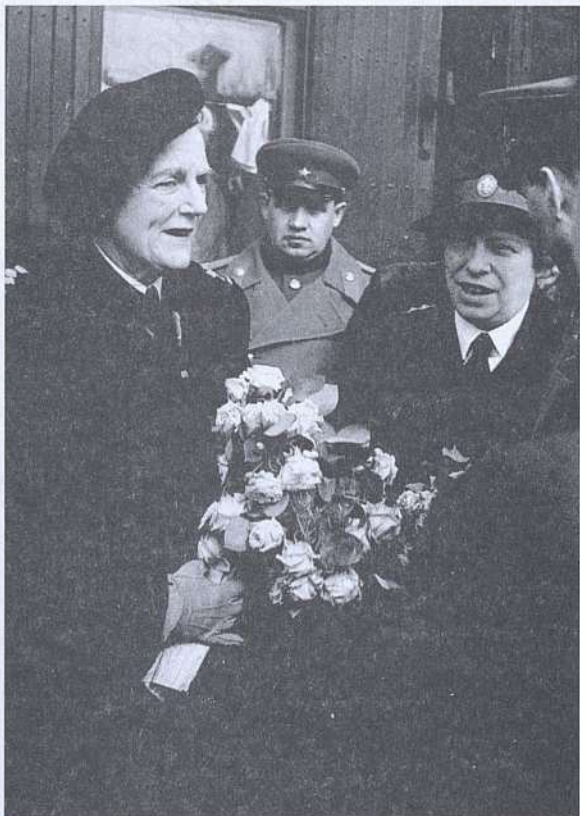
Госпожа Черчилль на Севастопольском вокзале. 24 апреля 1945г.

Обращает на себя внимание, что ее маршрут коренным образом отличался от маршрута Уинстона Черчилля, побывавшего в городе после окончания Ялтинской конференции. 13 февраля