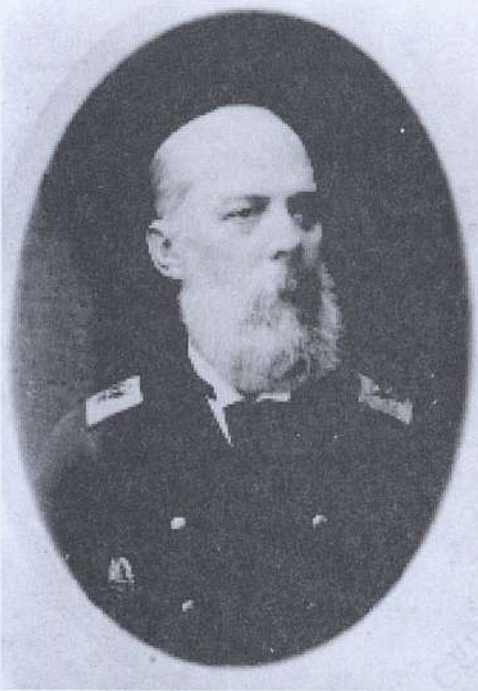
Контр-адмирал Карл Федорович Кульстрем, отец Сергея Карловича