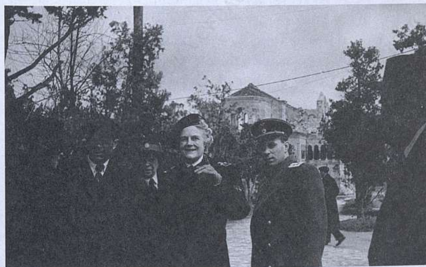
Клементина Черчилль у Владимирского собора в Херсонесе. 24 апреля 1945г.