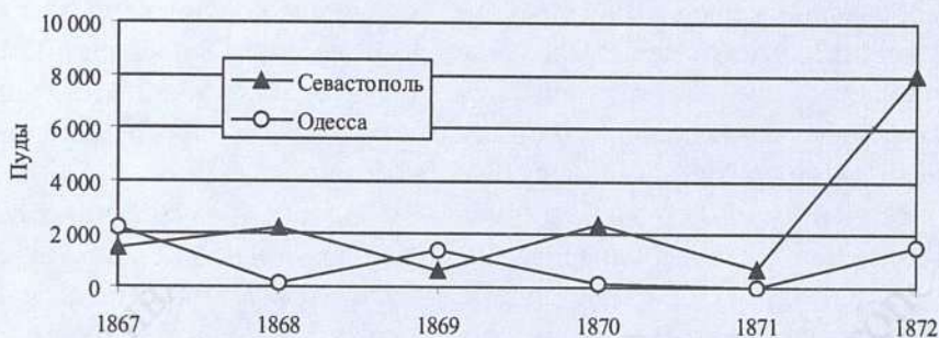
Рисунок 7. Экспорт железа из Севастопольского и Одесского порта, 1867–1872 гг., пуды

Что касается экспорта железа, то здесь, скорее всего, наблюдается практически ежегодное изменение грузопотока: железо вывозилось то из Одессы, то из Севастополя. Этот факт можно попытаться объяснить тем, что, возможно, в некоторые годы осуществлять вывоз железа было удобнее не через Одессу, а через Севастополь, либо по причине меньшей его загруженности в тот момент, либо исходя из соображений экономии времени. К примеру, из Константинополя в Одессу плавание занимало в среднем на день больше, чем в Севастополь. Отдельно стоит отметить, что вывоз железа через Севастополь осуществлялся на протяжении только шести лет, а не всего изучаемого периода. Количество железа, вывезенного за это время через севастопольский порт, было достаточно большим, что позволяет рассматривать железо в качестве одного из основных экспортных товаров в Севастопольском порту.