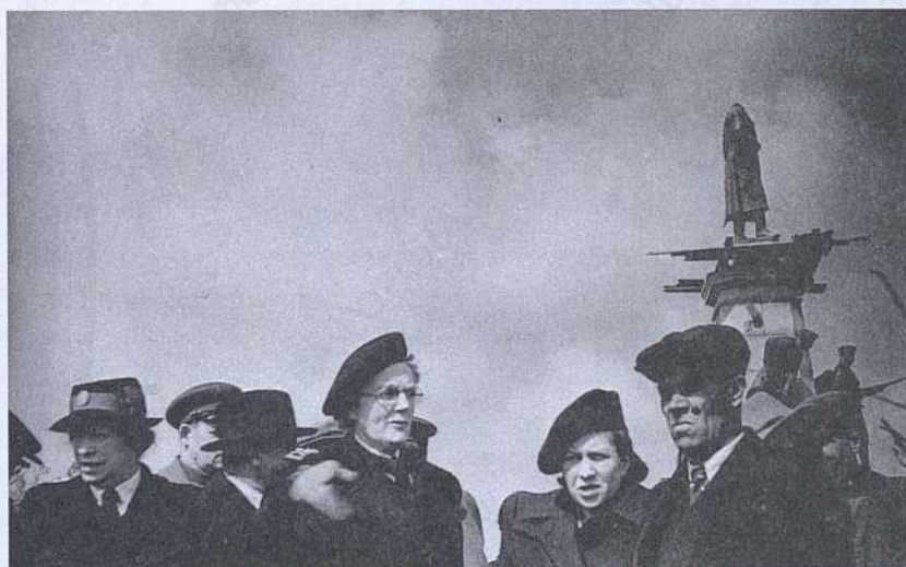
Клементина Черчилль на Историческом бульваре. 24 апреля 1945г.